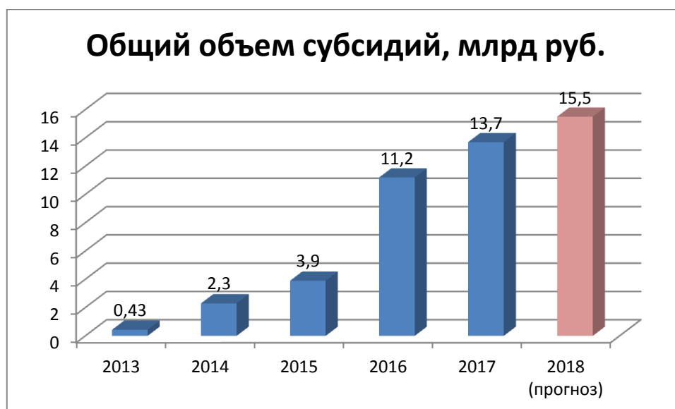
Диаграмма 1. Объемы средств, выделенных по постановлению №1432

Так, в 2013 году общий объем бюджетных средств, затраченных на реализацию программы, составил 430 миллионов рублей, а в 2014 он увеличился более чем в четыре раза. В этом году на поддержку предусмотрено 13,7 миллиардов рублей. С начала года производители сельхозтехники уже получили от государства субсидии в размере 8,9 миллиарда рублей. По нашему мнению, в 2018 году общий объем субсидирования снова необходимо увеличить до 15,5-16 миллиардов рублей. Связано это с тем, что курс рубля заметно укрепился на мировом рынке, а значит отечественная техника теряет свои ценовые преимущества перед зарубежными аналогами. Кроме того, снижение ключевой ставки Центрального Банка (в 2017 году ключевая ставка была снижена до 9,25%) позволит аграриям брать более дешевые кредиты для обновления своего машинного парка, что стимулирует спрос на сельскохозяйственную технику.