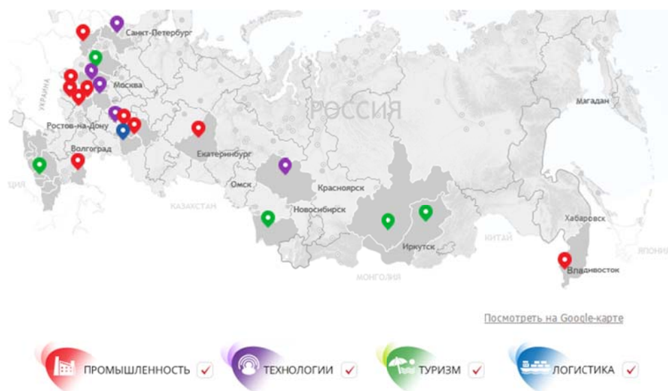
Рис. 1. Схема расположения ОЭЗ в России на 2017 год

На сегодняшний день в России действует 21 ОЭЗ, из них: 10 промышленно-производственных («Алабуга», «Липецк», «Тольятти», «Титановая долина», «Моглино», «Калуга», «Узловая»), 5 технико-внедренческих («Дубна», «Санкт-Петербург», «Технополис «Москва», «Томск», Иннополис»), 5 туристско-рекреационных («Байкальская гавань», «Бирюзовая Катунь», «Ворота Байкала») и 1 портовая («Ульяновск»). На рис. 1 отображена схема расположения ОЭЗ на 2017 год [3].