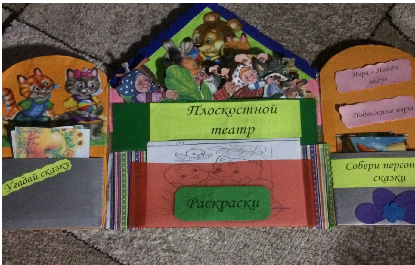
Материал для папки – передвижки