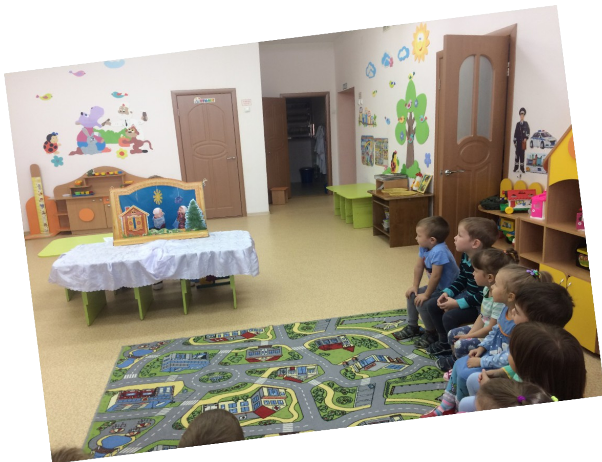
Развлечение с детьми с элементами лепки из соленого теста на тему: « В мире любимых сказок»