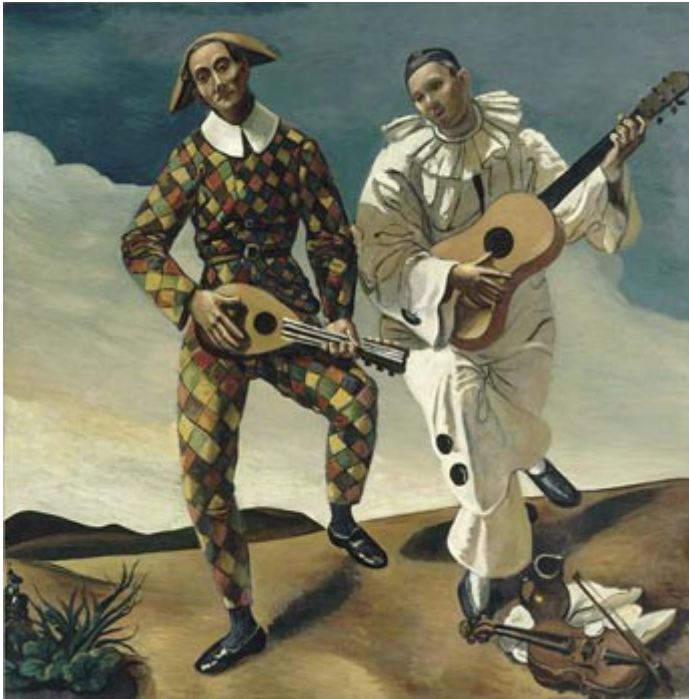
André Derain Arlequin et Pierrot

Parmi les Fauves il faut également citer Maurice de Vlaminck (1876- 1858 ) et André Derain (1880- 1954).