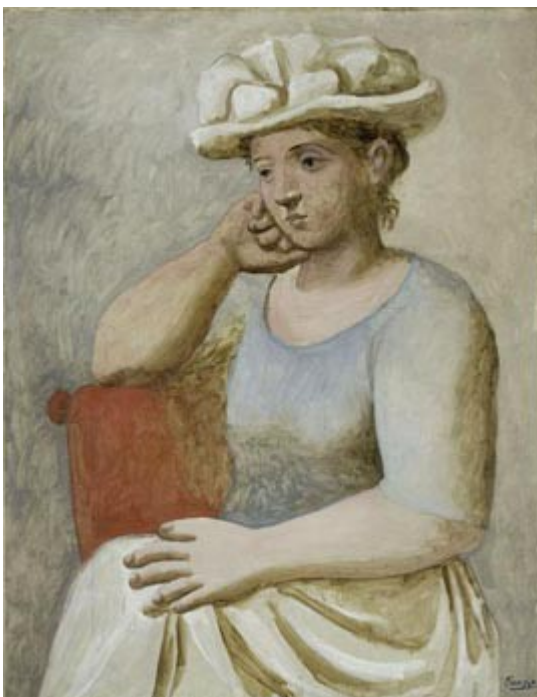
Pablo Picasso Femme au chapeau blanc

Pablo Picasso (1881- 1973) d'origine espagnole, est l'artiste le plus illustre de l'époque moderne. Il a exercé une influence profonde sur l'évolution de l'art moderne. Essayant une variété de techniques, il a réalisé une synthèse entre le cubisme et le surréalisme .