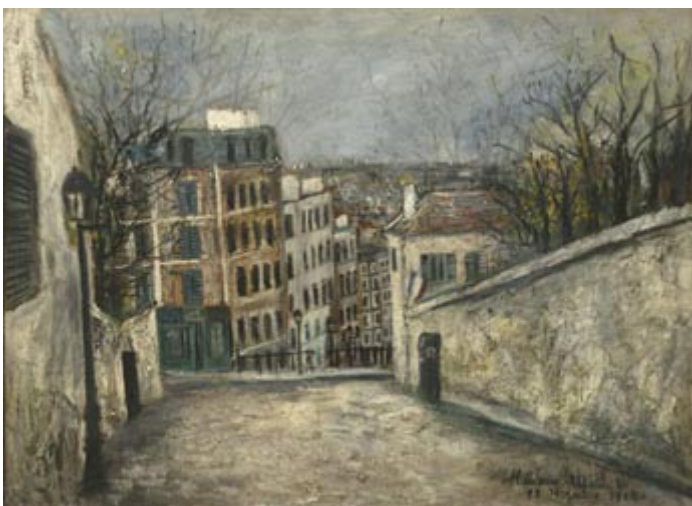
Maurice Utrillo Rue du Mont-Cenis

Maurice Utrillo (1883- 1955), peintre des coins de Montmartre;