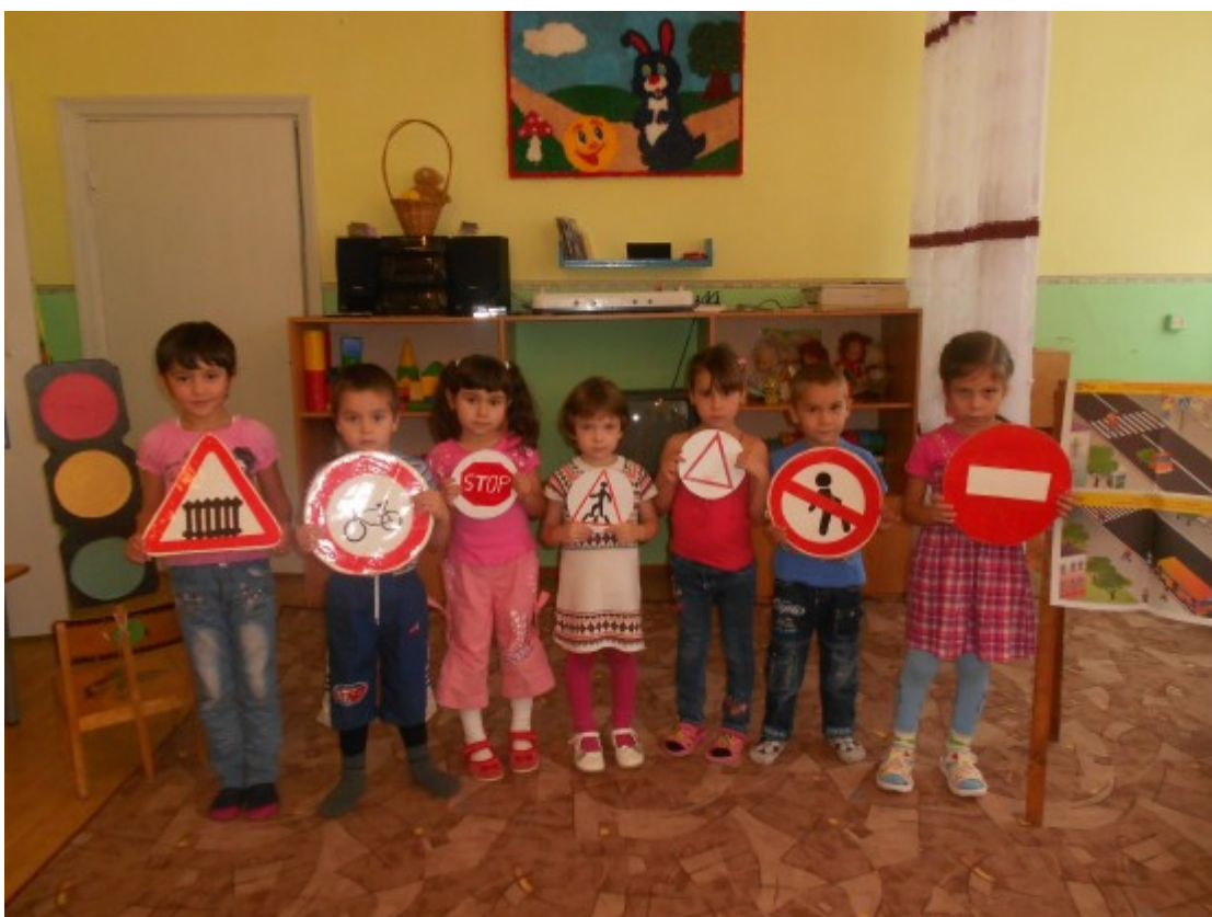
«Зачем нужны дорожные знаки» .