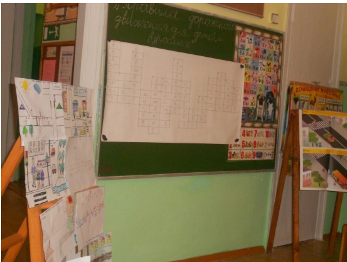
Выставка рисунков «Мой безопасный путь в детский сад». Родители справились с заданиями кроссворда (на доске) .