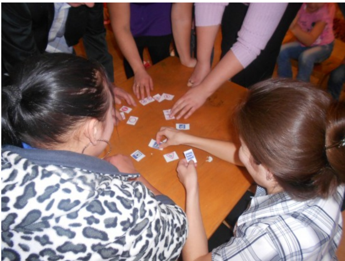
Родители выбирают запрещающие знаки, дети- разрешающие.