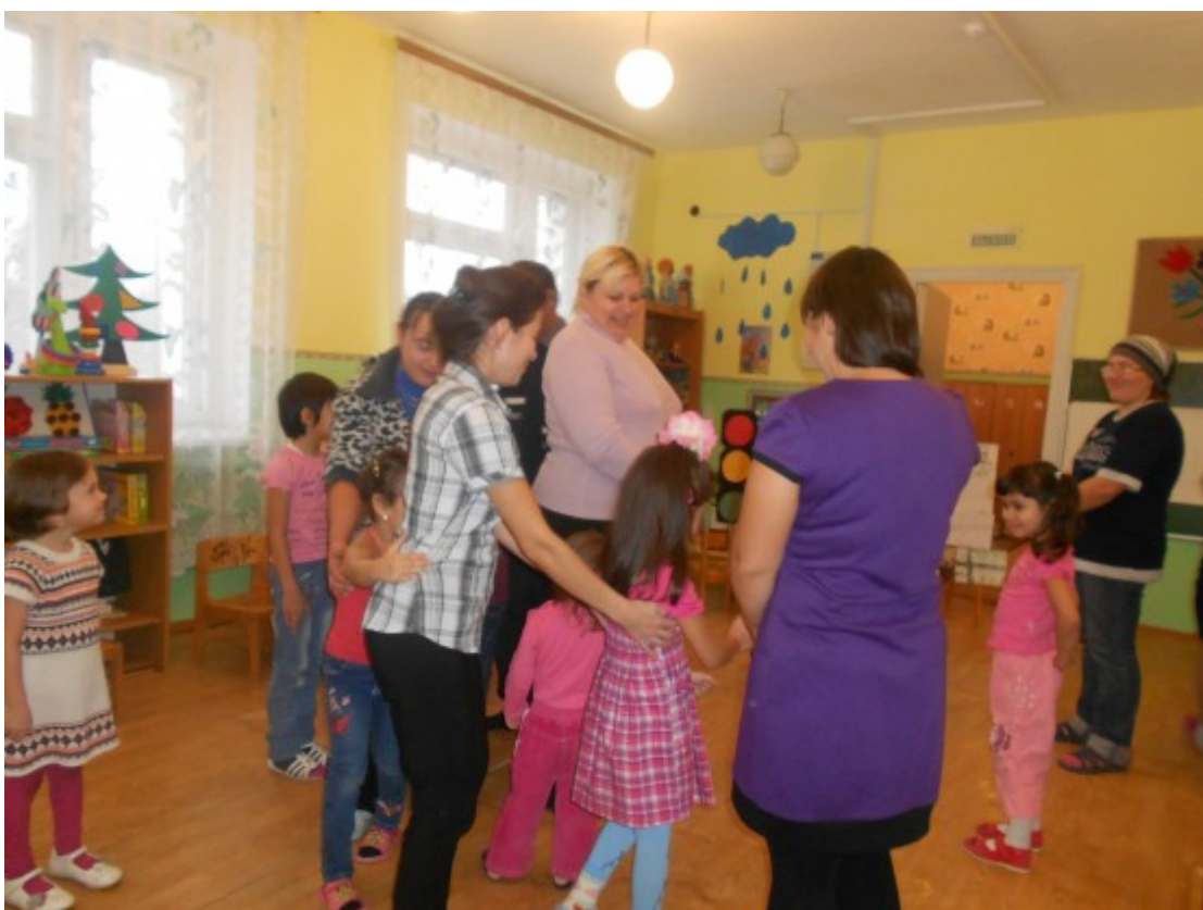
Игра - тренинг «Ночной поезд».