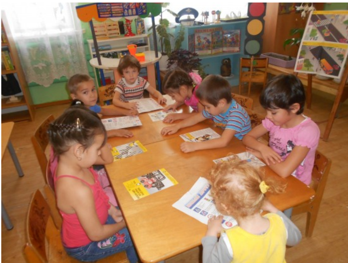
«Знай и выполняй правила дорожного движения».