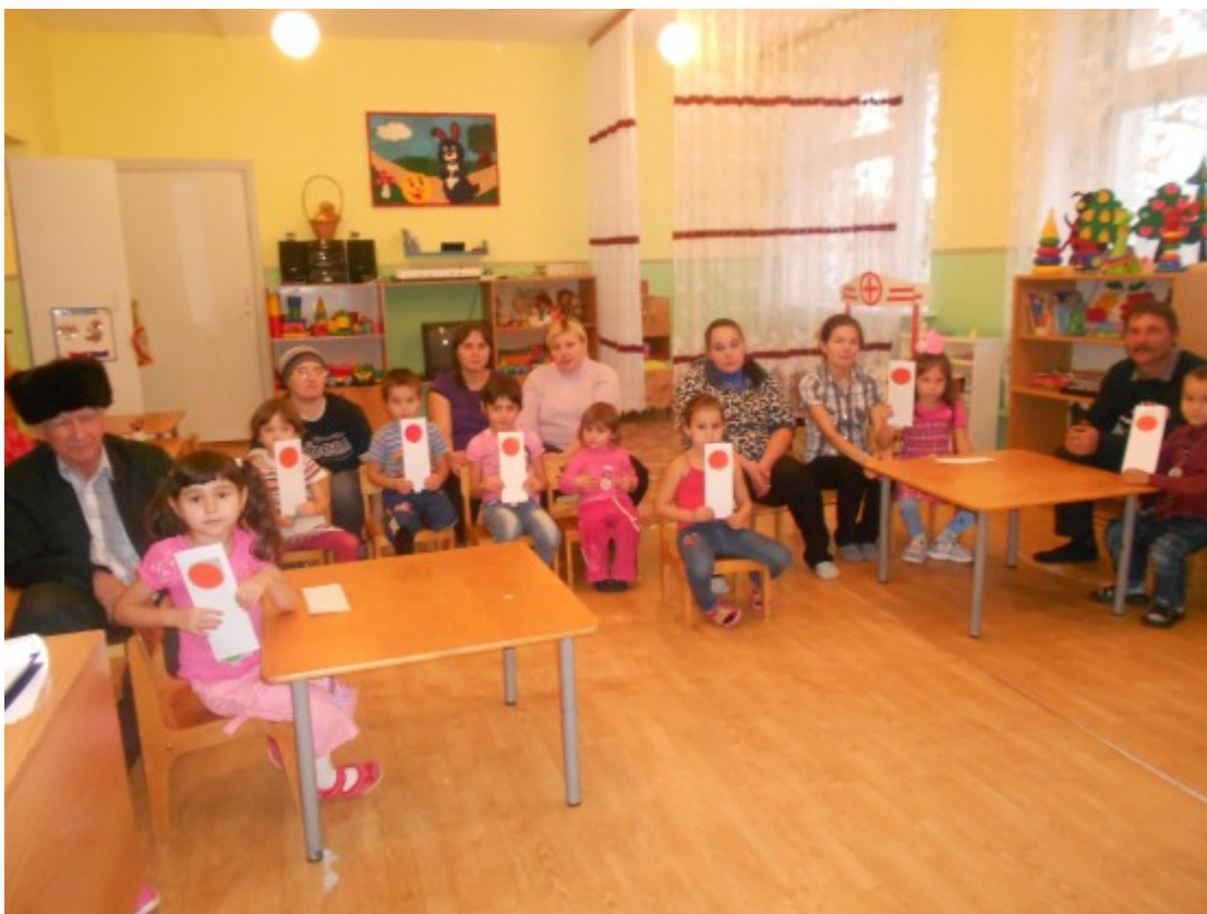
Родительское собрание «Правила дорожного движения для детей и взрослых».