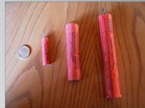
Типичные развлекательные петарды разной мощности