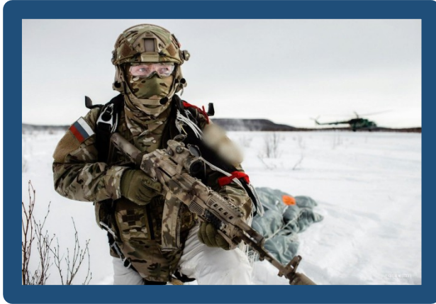
Спецназ ВДВ (воздушно-десантные войска)