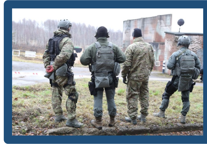
Спецназ служба внешней разведки Заслон