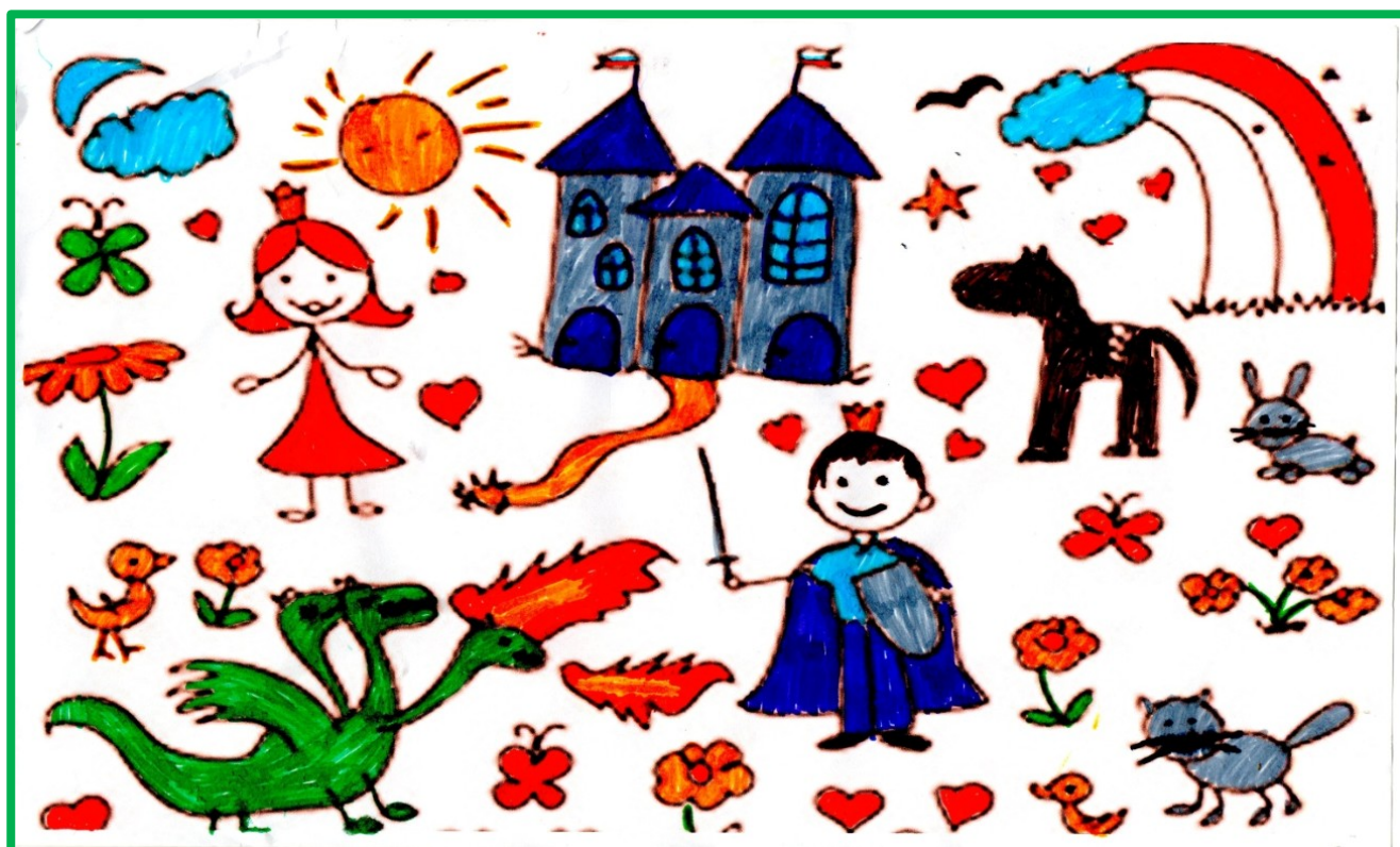
Э.ГЕБУСЫ ПРО СЛОВО «ФАНТАЗИЯ»