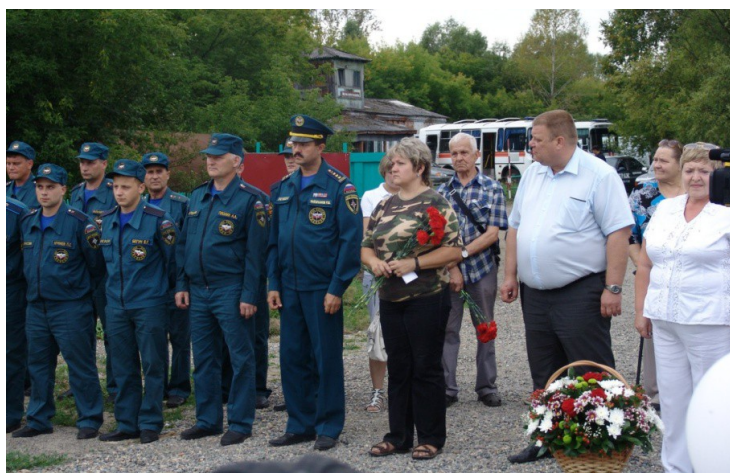
Фото №№ 22.23. 24. 25.