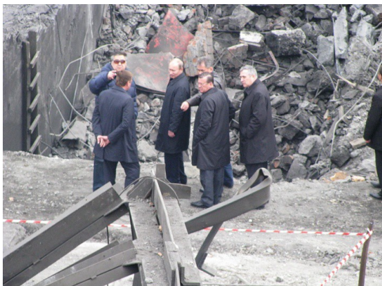
Фото №1. Премьер - министр В.В. Путин, губернатор Кузбасса А.Г.Тулеев, глава МЧС Шойгу С.К. осматривают последствия взрывов на шахте «Распадская»