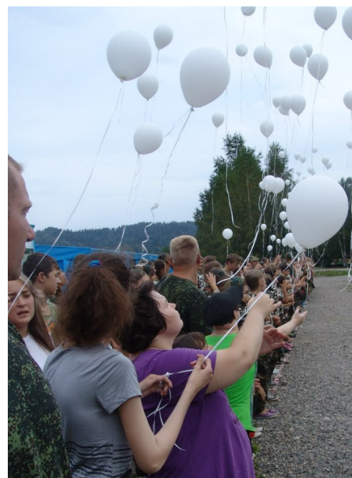
Фото №26 Аллея горноспасателей