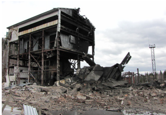
Фото №2. Фото №3. Разрушения после второго взрыва на стволе «Глухой»