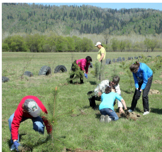
Фото №№16. 17. 18. Посадка сосен в Аллею горноспасателей 11.05.12