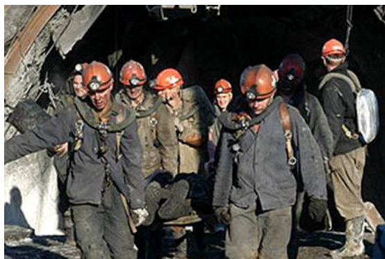
Фото №4. Горноспасатели выносят из шахты погибших.