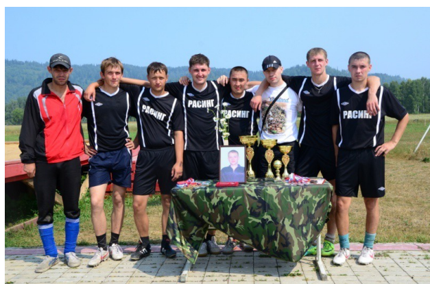
Фото № 10

Товарищеская встреча памяти А. Каюна по мини футболу в лагере «Ратник». 16.07.11г.