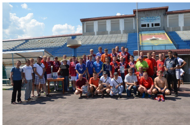
Фото № 11

Блицтурнир по мини - футболу памяти А.Каюна в лагере «Ратник». 21.07.2012г.