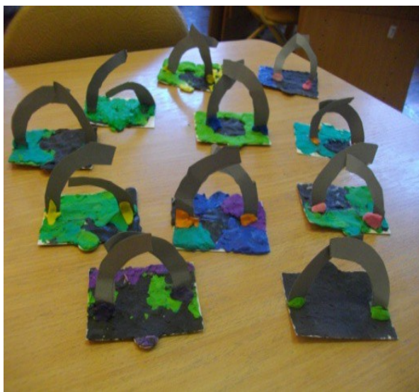
Рис. 9. Поделка «Разорванное кольцо»