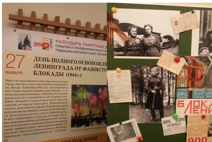
Рис. 7. «Символы военного времени». Проект