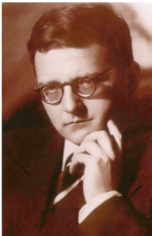
Рис. 8. Портрет Д. Шостаковича