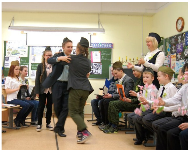
Рис. 19. Вальс в исполнении учеников 9 класса Ученик 9 класса

Гремел неумолкаемо салют Из боевых прославленных орудий. Смеялись, пели, обнимались люди... (Воспитатель раздает платочки и букетики цветов) Танец «Вальс»