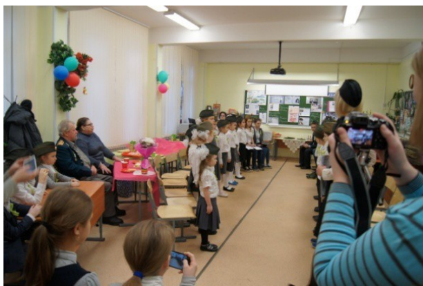
Рис. 11. Расстановка 1 класса