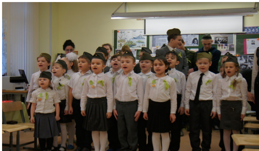
Рис. 21. Исполнение финальной песни

(на последних строках 1 класс уходит первоклассники выбегают с султанчиками)