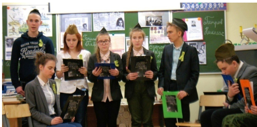
Рис. 12. Вступительные слова 9 класса