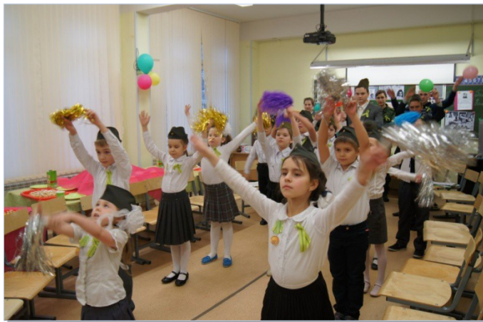
Рис. 22. Заключительный танец