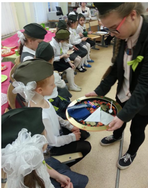
Рис. 15. Игра «Блокадный набор»