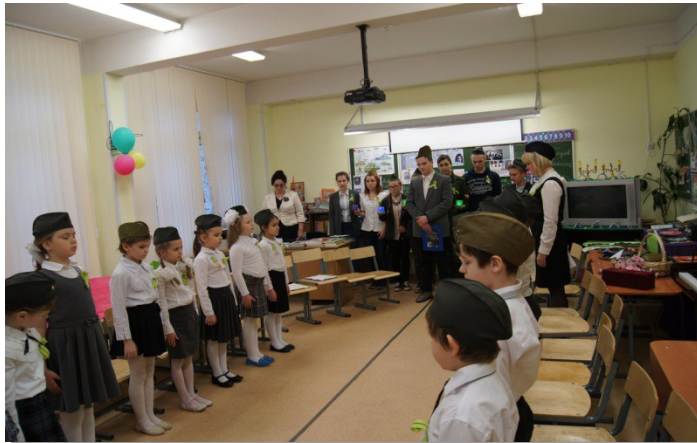
Рис. 20. Минута молчания

Учитель: Минута молчания – в ней не 60 секунд. В ней - 900 блокадных дней и ночей. Эта минута – самая тихая, самая скорбная, самая гордая.