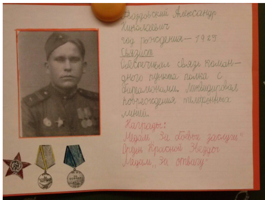
Рис. 4. «Книга памяти». Проект