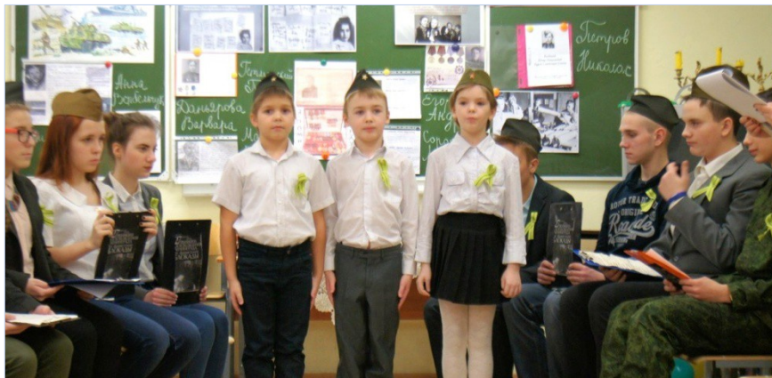
Рис. 16. Первokлассники читают стихи