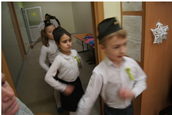
Рис. 10. Выход 1 класса

( Под музыку первоклассники входят в класс, маршируют, останавливаются у стульев)