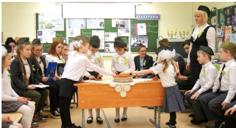
Рис. 18. Первоклассники маскируют модели памятников