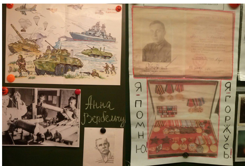
Рис. 5. «Книга памяти». Проект