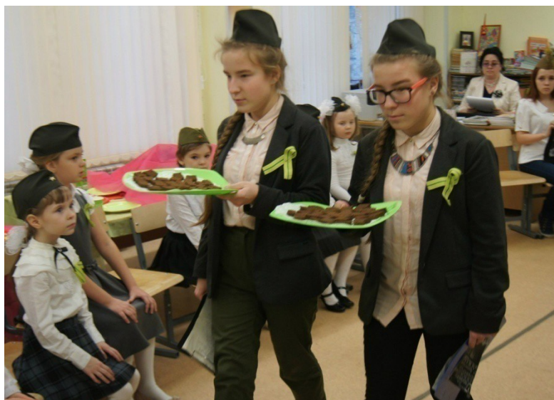
Рис. 13. Раздача гостям символического хлеба

Хлеб был практически единственным питанием ленинградцев. Мамы берегли драгоценный кусочек – дневную норму. Выдавали своим детям по маленькому кусочку, часто прятали. [1]