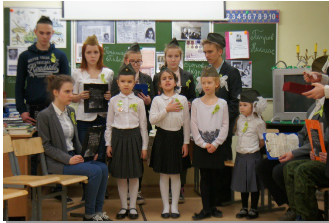
Рис. 17. Исполнение стихотворения «Моя медаль»

На фоне песни «Дети войны» читается стих О. Берггольц «Моя медаль» [3]