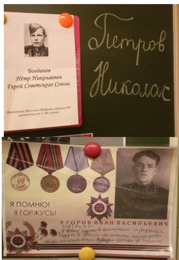
Рис. 1. «Книга памяти». Проект