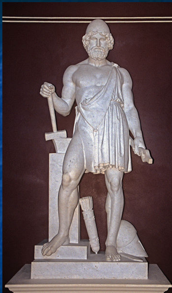
Гефест – бог кузнечного дела в греческой мифологии