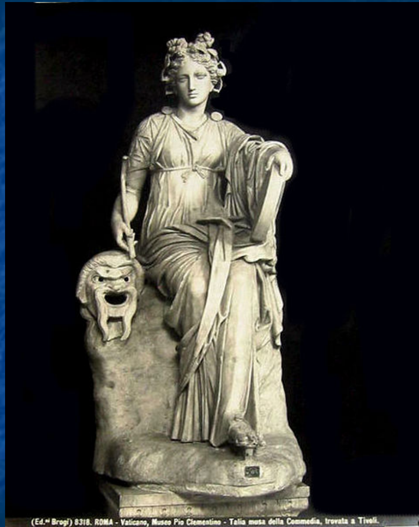
(Ed. Brugi) 9318. ROMA - Vaticano, Museo Pio Clementino - Talia musa della Commedia, trovata a Tivoli.