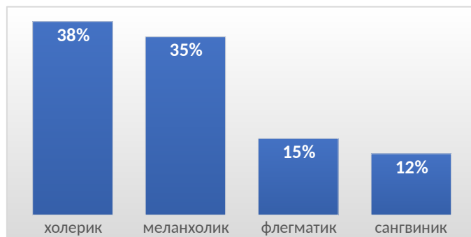
Рис.2 Результаты исследования темперамента у подростков по методике Г. Айзенка в 2019 году ( в %).

Изучив полученные результаты по методике Г.Айзенка за 2019 год, мы пришли к заключению, что большую часть выборки составляют респонденты, у которых преобладает холерический тип темперамента (38%), на втором месте иерархии– меланхолики (35%), флегматики – 15% и менее всего представлен – сангвинический тип темперамента (12%). Для наглядности полученные данные мы представили в виде рисунка 2.