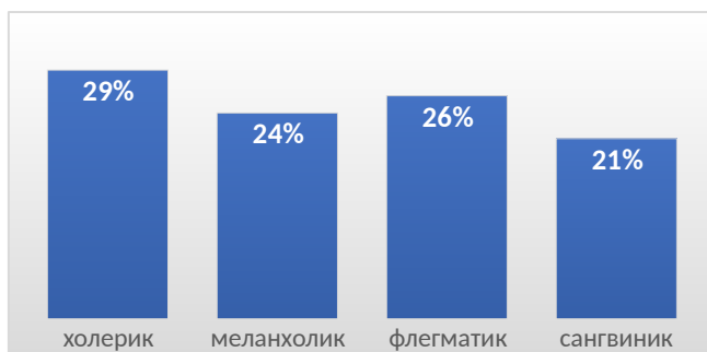
Рис.1 Результаты исследования темперамента у подростков по методике Г. Айзенка в 2016 году ( в %).

В 2016 году было проведено первое исследование с целью изучения типов темперамента. Как мы помним, темперамент, хоть и база личностных качеств индивида, но способен к коррекции и особенно в подростковом возрасте. Итак рассмотрим сначала результаты за 2016 год на 7-9 классах (рис.1).